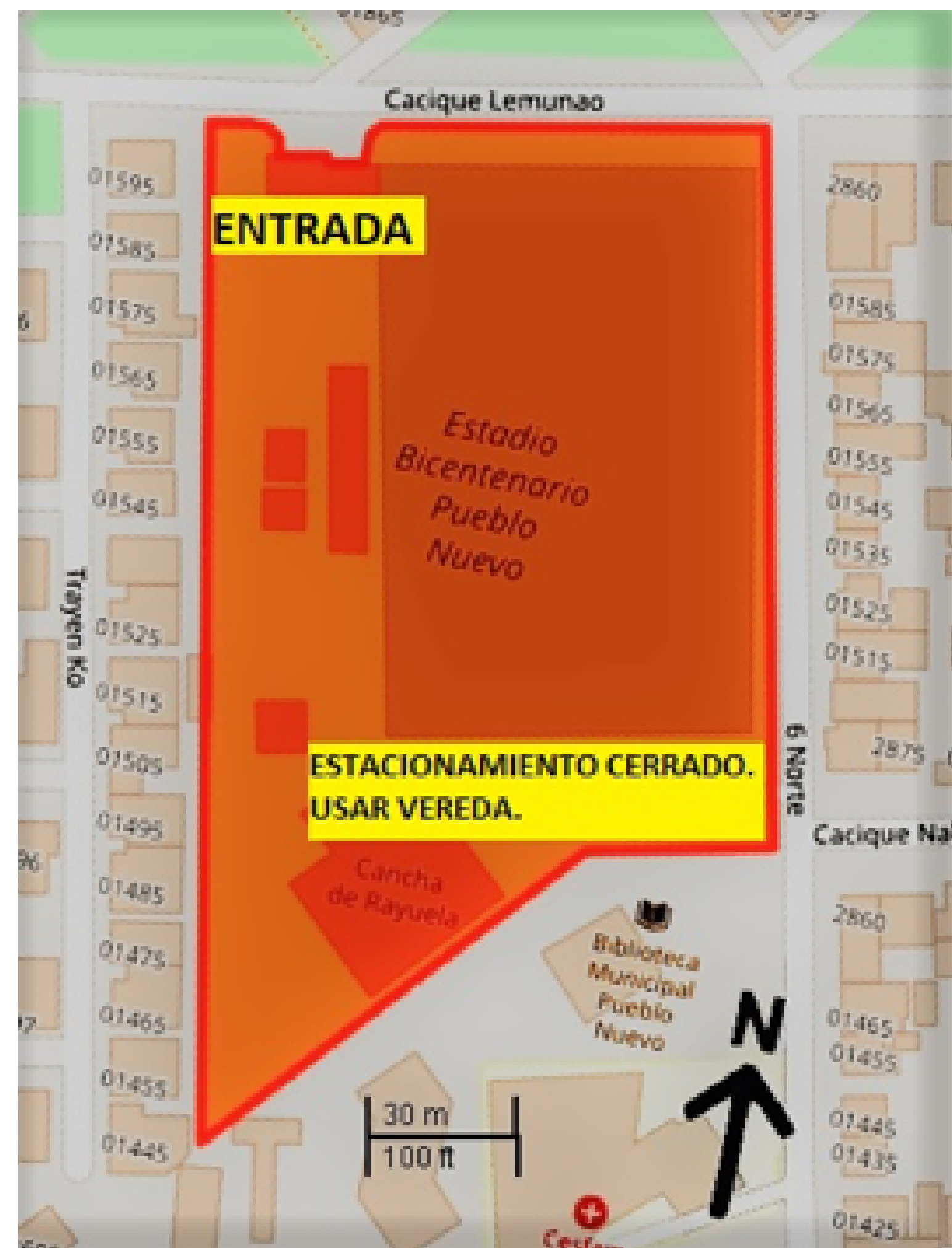
Dirección calle Cacique Lemunao 2750, Temuco, Araucanía

Así mismo, las fechas y horarios subsiguientes serán fijadas de acuerdo a la disponibilidad de recintos; las condiciones climáticas no serán motivo de suspensión de fechas, a excepción de algunas situaciones en donde el clima realmente impide desarrollar los partidos adecuadamente, decisión que estará a cargo de la organización y que será informada oportunamente a través de todos los medios disponibles.