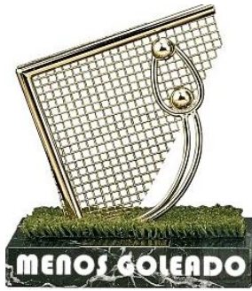
Trofeo: Valla menos batida.