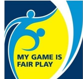
Trofeo Equipo Fair- play.