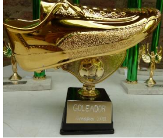
Trofeo: Equipo más goleador.